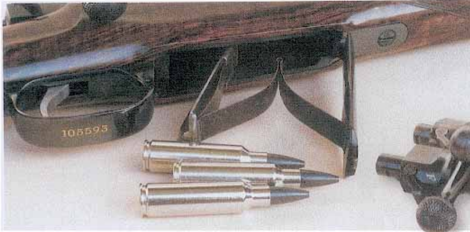
DAS KLAPPMAGAZIN FASST DREI PATRONEN.