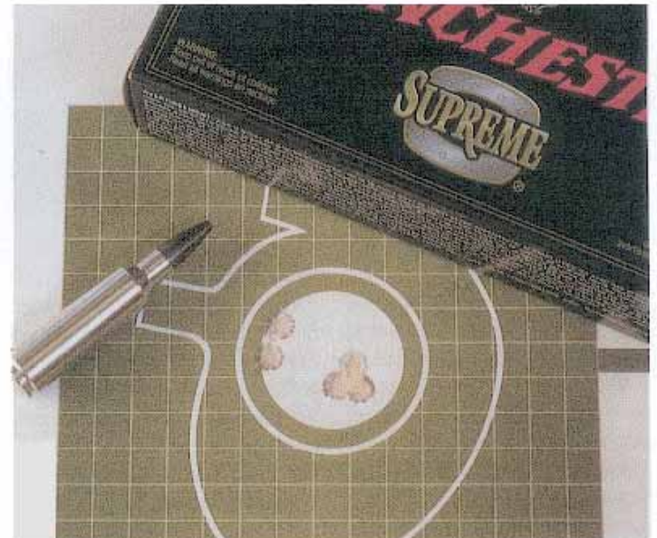
DAS SCHUSSBILD DER WAFFE MIT FÜNF SCHUSS: 3,6 ZENTIMETER

und am Vorderschaft ist scharf, sehr fein geschnitten und hält auch der Betrachtung unter einer Lupe stand. Die Oberfläche des