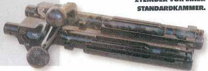
DER KÜRZERE VERSCHLUSSZYLINDER VOR EINER STANDARDKAMMER.