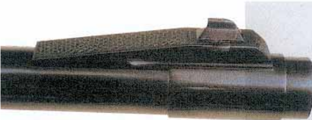
DER KORNSATTEL IST MIT EINEM RING ÜBER DEN LAUF GEZOGEN.